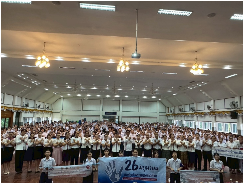
กิจกรรมวันต่อต้านยาเสพติด