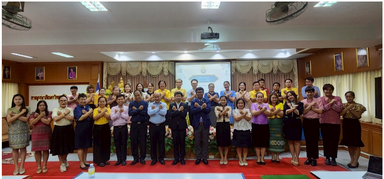
การอบรมหลักสูตรปราบปรามทุจริต